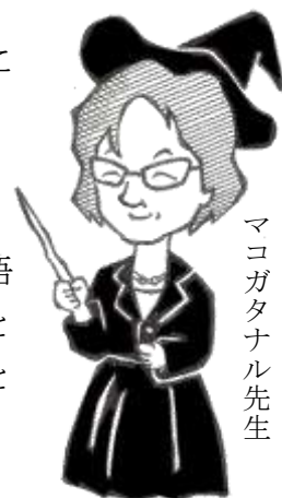
明治魔法学校 マコガタナル先生

『M』復刊、おめでとうございます。このような血の通ったメディアが、改めて出会いと語らいのきっかけを提供してくれるであろうことを、ちょっと古株になりつつある教員の1人として大変嬉しく思います。